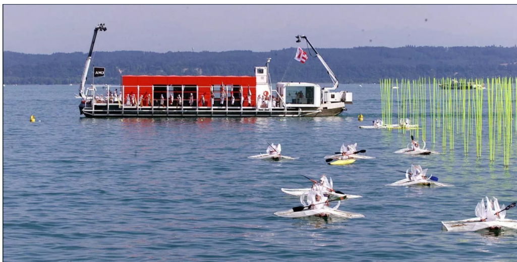
FIGURE 5 – «L'artéplage mobile lors de la journée officielle du canton du Jura, le 23 juin 2002, à Neuchâtel», 23 juin 2002.

Les participants sont répartis en 13 hordes. Une horde est constituée d'un groupe de personnes, réunies selon une caractéristique : leur moyen de déplacement, leur provenance, leur activité, etc... Parmi ces hordes il y a notamment : des cavaliers accompagnés de 90 chevaux Franches-Montagnes, des spectacles d'écoliers, une horde de parachutes, des kayakistes déguisés en nénuphars, une fanfare de près de 200 instrumentistes ou encore des chanteurs.