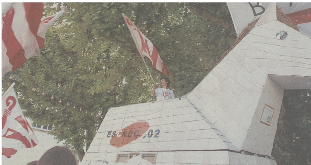
FIGURE 8 – Inconnu, «Le Groupe Bélier s'était emparé du cheval de Troie présenté en Juin dernier à Neuchâtel lors de la journée cantonale du Jura à l'Expo.02, pour le rebaptiser à sa manière.», 23 juin 2002

Du côté du Groupe Bélier, celui-ci en a profité pour aller déranger la manifestation à Neuchâtel, en détournant certaines représentations, voir figure 8. Ils ont par exemple rebaptisé le cheval par «Escroc.02».