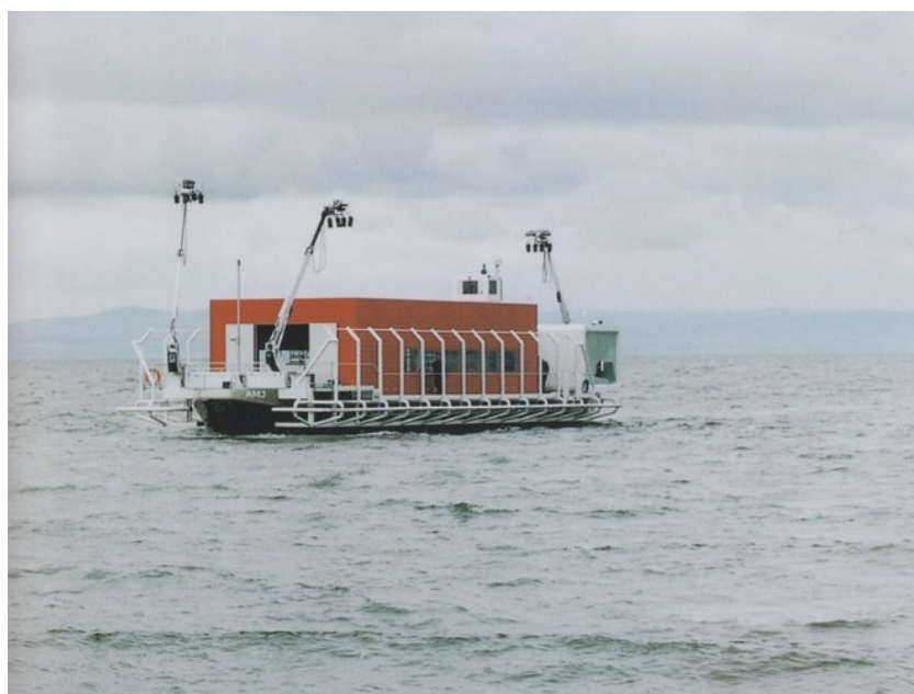
FIGURE 4 – Source : INCONNU. « Arteplage Mobile du Jura - Thèmes ». In : L'Association des Anciens d'Expo.02 (). Consulté le : 2023-03-07. URL : https://ex-expo.ch/fr/expo02/artepages/amj

Pour mieux se rendre compte de l'esthétique de l'AMJ, la figure 4 montre une photographie du bateau en navigation.