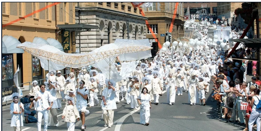
FIGURE 7 – © BIST/Roger Meier, «Mille six cents Jurassiens, répartis en 14 hordes blanches, 75 chevaux, des parapentes et des canoës avaient déferlé, le 23 juin 2002, sur l'artepilage de Neuchâtel à l'occasion de la journée cantonale du Jura.», 23 juin 2002.

Source : Thierry BÉDAT. « Expo.02, 20 ans après : C'était hyper-stimulant, ça jaillissait de tous côtés! » In : Le Quotidien Jurassien (9 mai 2022). Consulté le : 2023-05-01. URL : https://www.lqj.ch/series/expo02-20-ans-apres/cetait-hyper-stimulant-ca-jaillissait-de-tous-cotes/