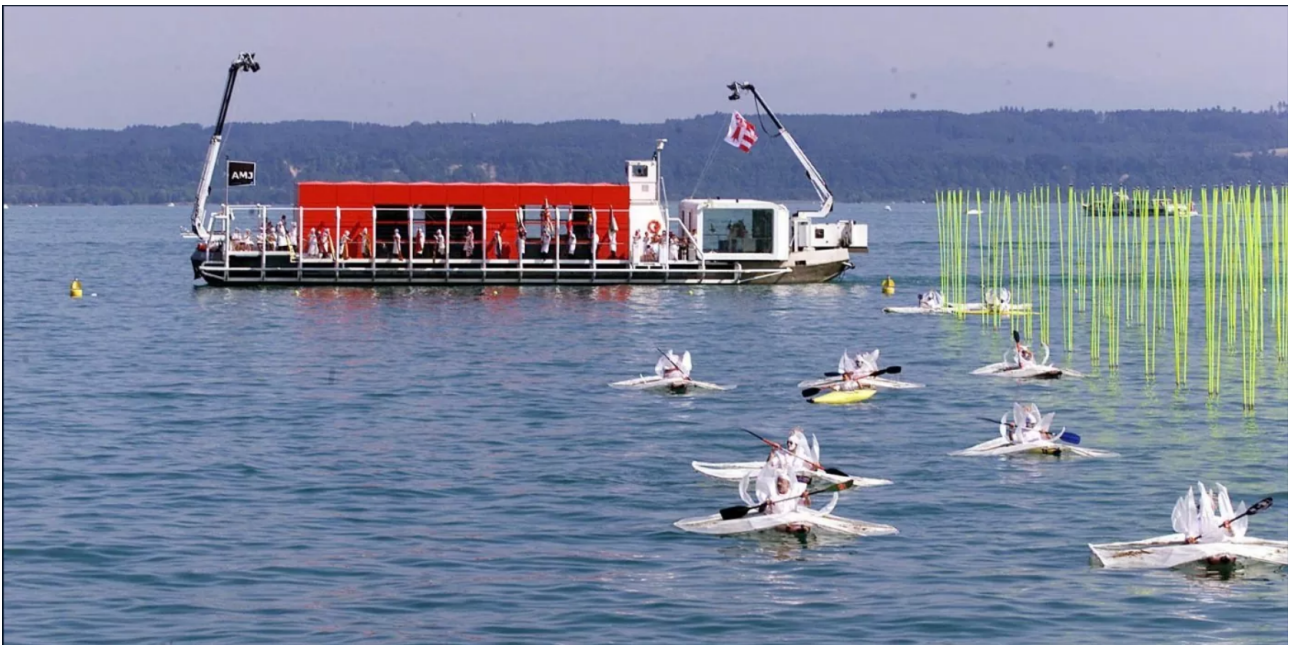
FIGURE 1 – © BIST/Stéphane Gerber, «L'arteplage mobile lors de la journée officielle du canton du Jura, le 23 juin 2002, à Neuchâtel», 23 juin 2002.

Source : Thierry BÉDAT. « Expo.02, 20 ans après : C'était hyper-stimulant, ça jaillissait de tous côtés! » In : Le Quotidien Jurassien (9 mai 2022). Consulté le : 2023-05-01. URL : https://www.lqj.ch/series/expo02-20-ans-apres/cetait-hyper-stimulant-ca-jaillissait-de-tous-cotes/