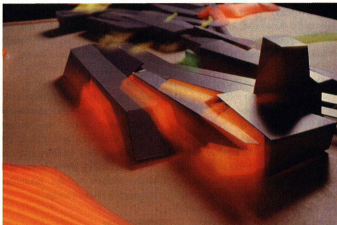
Leuchtende, weiche Erdhügel strukturieren den Expopark, den Garten des Begehrens und des Verlangens (oben).