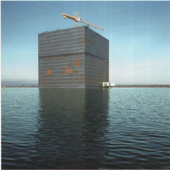
12. Dezember 2001

tigem Hirn, der glaubt, dass nur das Wort und der Begriff ein Weg zur Vernunft wären und die Bibliothek ihr Hort. Die Architekten, Designerinnen, Szenografen, Organisatoren, Moderatorinnen, Sprachkünstler, Kunstwissenschaftler, Verwalterinnen und Fädenzieher der Direction artistique haben zusammen mit Heerscharen von Autorinnen und Autoren der einzelnen Pavillons die Bildermaschinen angeworfen. Sie verflechten Geschichten mit Räumen, sie machen auch uns Besucher zu Bildern und werden uns mit vielerlei Konserven zu Installationen verbinden. Sie werfen alle Register an, auf dass wir loslassen und uns im Zeichenrausch des fröhlichen Babylons vergnügen, wohlwissend, wie süß und dauernd der Bilderkater sein wird. Der Grossvater schwärmte vom Schiffli-bach, der Vater vom Mesoscaphe und schon vor der Eröffnung der Expo soll die Tochter vom Monolithen träumen. Wir begreifen: Erinnern geht über Bilder besser als über Begriffe.