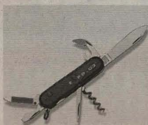
Das Expo-Taschenmesser: neu erhältlich im E-Shop.

Die Expo.02 hat auf ihrer Website einen Online-Shop eröffnet. Hier finden Sie sämtliche Expo-Artikel zum Kauf. Vom T-Shirt über Schirmmützen, Comics, Regenschirme und dem Buch über Maskottchen Lili bis hin zu Wein, Parfüms, Taschenmesser und Badewäsche – die Auswahl ist gross. «Da die Nachfrage nach Expo-Produkten